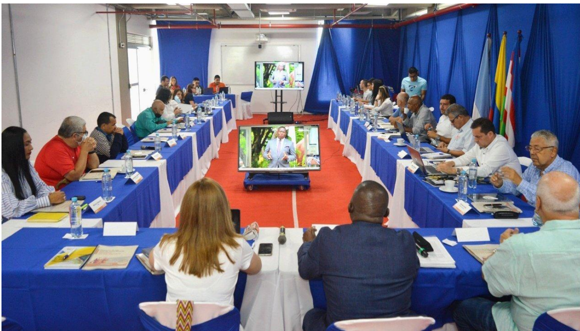
Figura 1. Mesa técnica proyecto de ley 003 de 2022.

Finalmente, vale la pena aclarar que en mesa técnica adelantada en la ciudad de Cali el 28 de agosto de 2022, la senadora Norma Hurtado Sánchez concertó con diferentes actores del Sistema Nacional del Deporte diversos ajustes del texto original que es utilizado para acumular con el Proyecto de Ley 182. El texto varió significativamente de la siguiente forma: